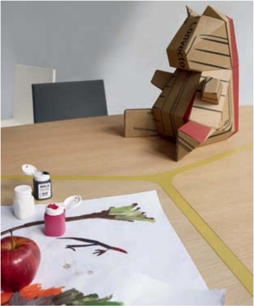
SEVEN, TAVOLO, TABLE, TISCH, MESA ALMA, SEDIE, CHAIRS, CHAISES, STÜHLE, SILLAS