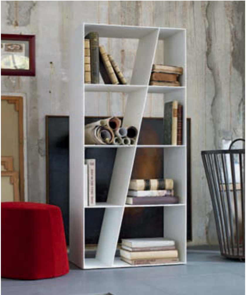
IN QUESTA PAGINA/IN THIS PAGE: SHELF , LIBRERIA_BOOKCASE_BIBLIOTHÈQUE_BÜCHERREGAL_LIBRERÍA FRANK , ELEMENTO DI SERVIZIO_SERVICE ELEMENT_ÉLÉMENT DE SERVICE_BEISTELLTISCH_ELEMENTO DE SERVICIO NELLE PAGINE PRECEDENTI E SUCCESSIVE/PREVIOUS AND NEXT PAGES: CHARLES , SISTEMA DI SEDUTE_SEATING_SYSTEM_SYSTÈME D'ASSISES_SITZSYSTEM_SISTEMA DE ASIENTOS FAT-SOFA , POUF_OTTOMAN_POUF_ HOCKER_PUF SHELF , LIBRERIA_BOOKCASES_BIBLIOTHÈQUES_BÜCHERREGAL_LIBRERÍAS FRANK , ELEMENTO DI SERVIZIO_SERVICEELEMENTS_ÉLÉMENTS DE SERVICE_BEISTELLTISCHE_ELEMENTOS DE SERVICIO MART , POLTRONCINA_SMALL ARMCHAIR_PETIT FAUTEUIL_KLEINER SESSEL_BUTAQUITA