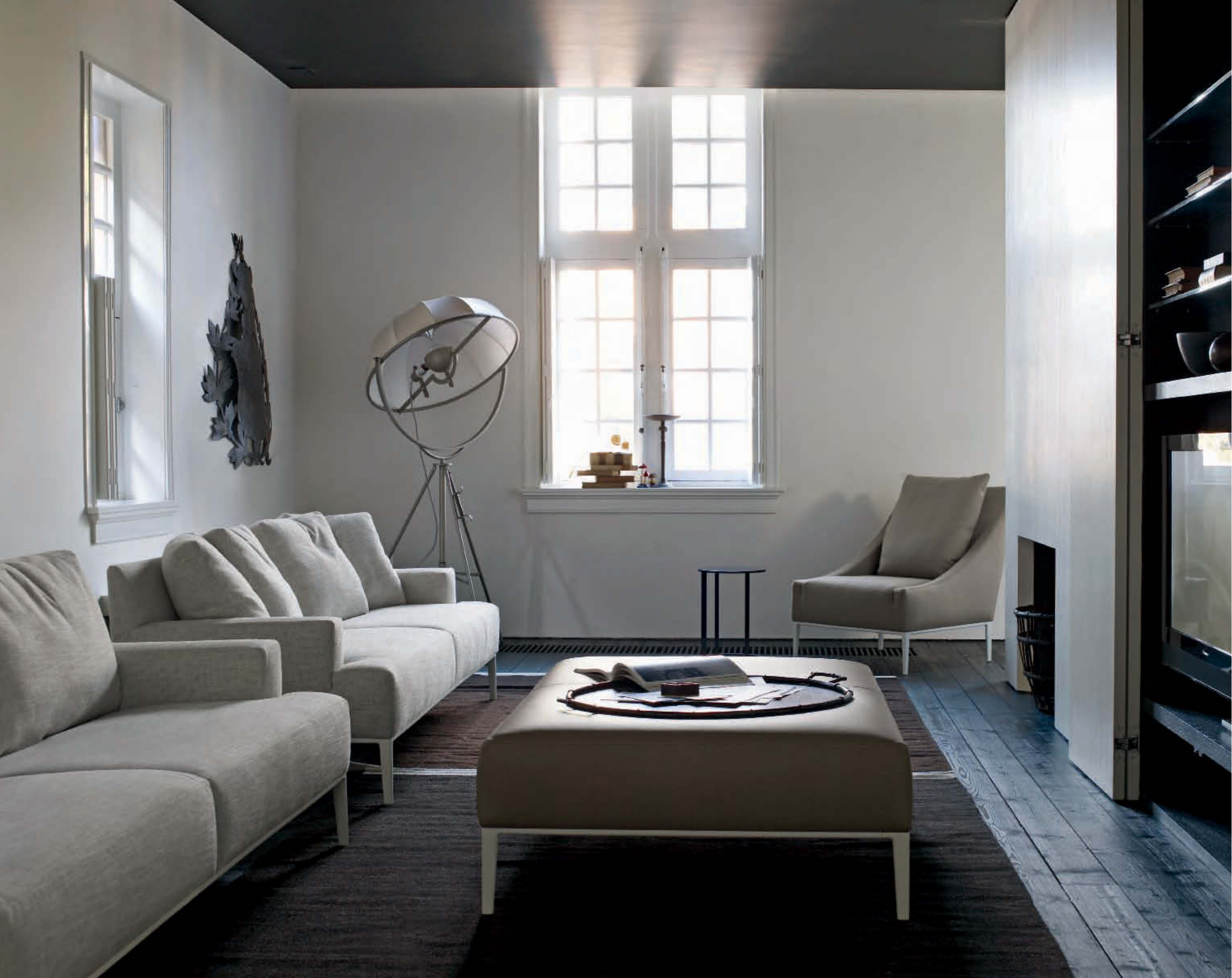
JEAN, DIVANI, POUF E POLTRONA_SOFAS, OTTOMAN AND ARMCHAIR_CANAPÉS, POUF ET FAUTEUIL_SOFAS, HÖCKER UND SESSEL_SOFAS, PUF Y BUTACA FRANK, ELEMENTI DI SERVIZIO_ELEMENTS, ÉLÉMENTS DE SERVICE_BEISTELLTISCHE_ELEMENTS DE SERVICIO