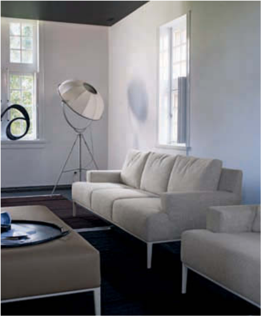
JEAN, DIVANI E POUF_SOFAS AND OTTOMAN_CANAPÉS ET POUF_SOFAS UND HÖCKER_SOFÁS Y PUF