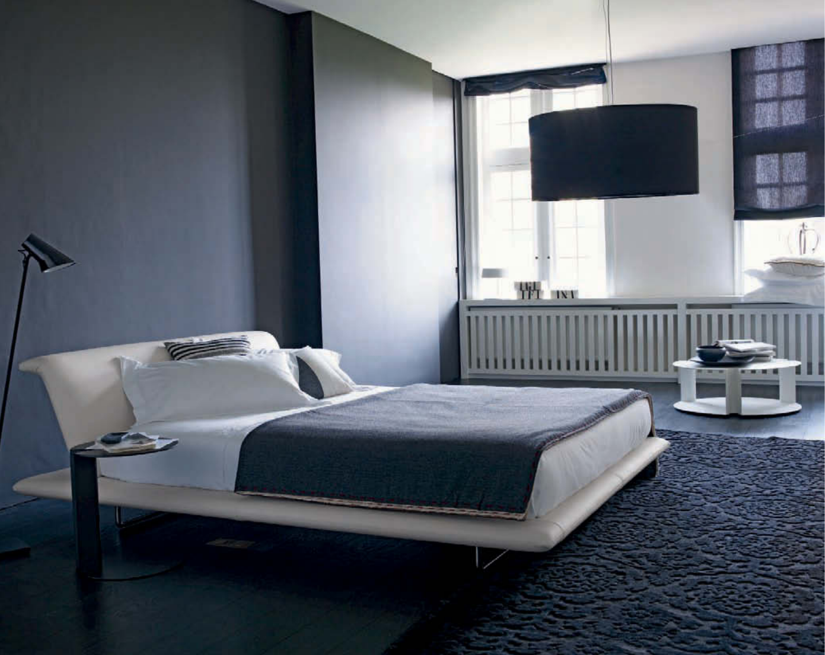
SIENA, LETTO, BED, LIT, BETT, CAMA NIX, ELEMENTI DI SERVIZIO, SERVICE ELEMENTS, ÉLÉMENTS DE SERVICE, BEISTELLTISCHE, ELEMENTOS DE SERVICIO