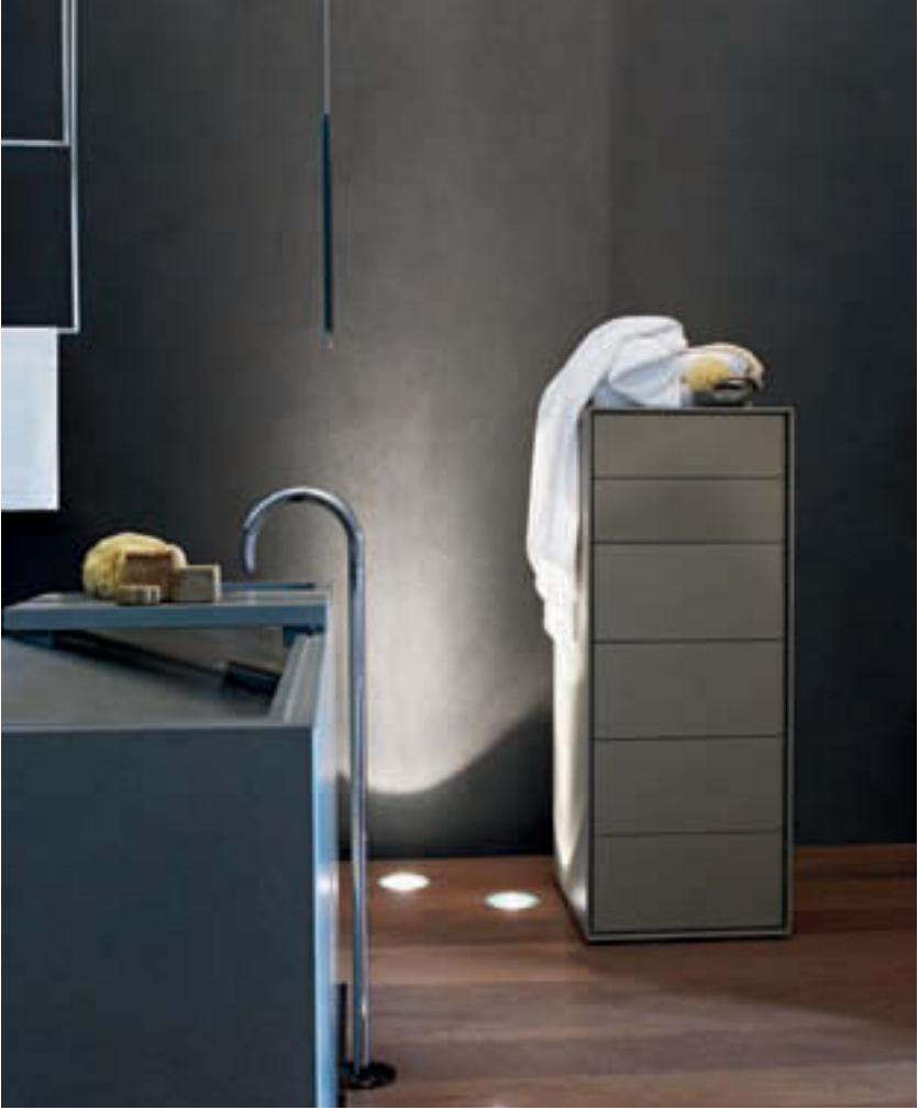
DADO, CASSETTIERA, CHEST OF DRAWERS, ÉLÉMENT À TIROIRS, SCHUBLADENELEMENT, CAJONERA AWA, ELEMENTO DI SERVIZIO, SERVICE ELEMENT, ÉLÉMENT DE SERVICE, BEISTELLTISCH, ELEMENTO DE SERVICIO